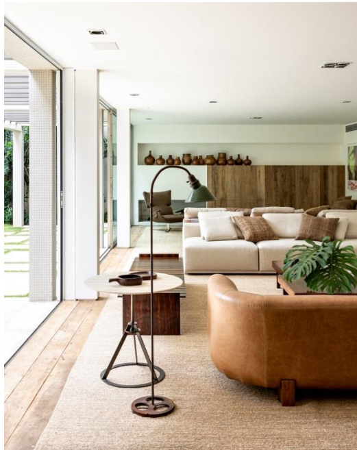
Sofá Fusca por Arthur Casas, Micasa; Sofá Henge, Herança Cultural; Luminária Old, Micasa;