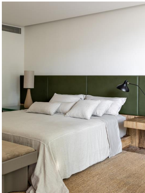
Banco Tangram, Beraldin; Luminária Emiliano por Arthur Casas, Studio Objeto; Luminária Mantis, Dimlux;