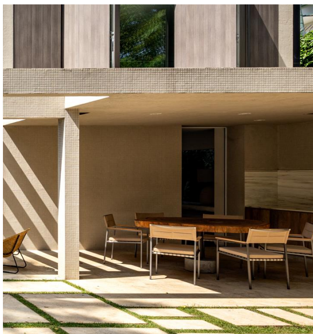
Mesa em Tora, Tora Brasil; Cadeira Time Out, Diamond