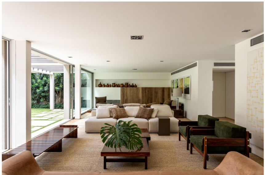
Sofá Fusca por Arthur Casas, Micasa; Banco de Jacarandá, Varuzza; Mesa Plain Flexiform, Casual;