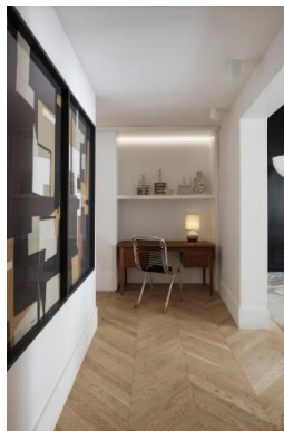
Cadeira 1930 , Michel Dufet, Ecart International; escrivaninha vintage escandinava 1960 em teca , 1STDIBS; obras de arte abstratas , Raymond Guerrier; abajur de cerâmica, antiquário.