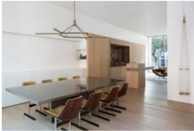
Mesa Esquadro, por Arthur Casas Design e Primo Vidros, Primo Vidros; Cadeira Marina, por L'Atelier, Loja Teo; Pendente Pris Crown, Pelle Design Store; peça Asterismos, por Artur Lescher.