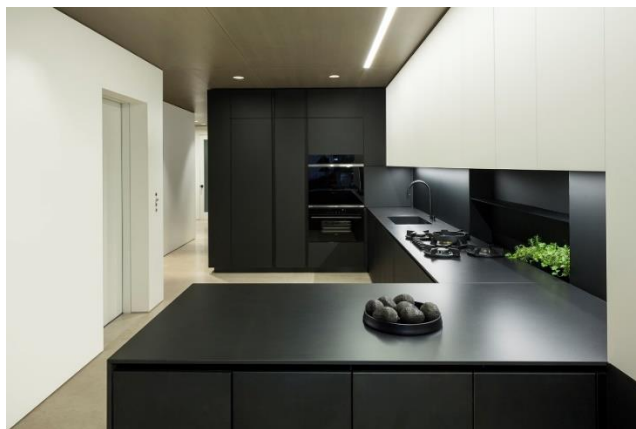
Cozinha customizada, Bазеео por NY Loft.