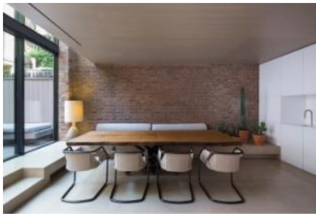
Cadeira Strip, por Massimo Castagna, Henge; Mesa de Jantar Guaçu, Tora Brasil; Abajur Vintage, Casas Edições; Cafeteira TopBrewer, Scanomat.